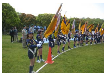
（隊旗を持ったくまスカウト）