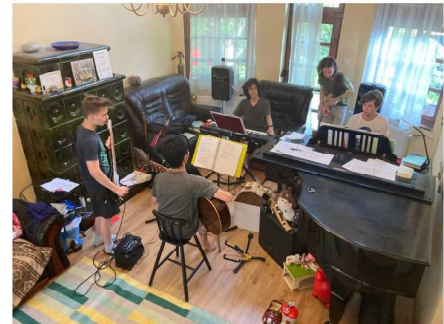
自宅でのユースバンド練習風景