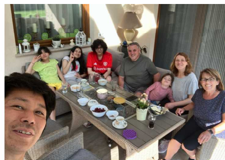
家主さんご夫妻と