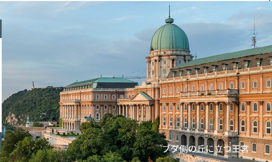
ブダ側の丘に立つ王宮