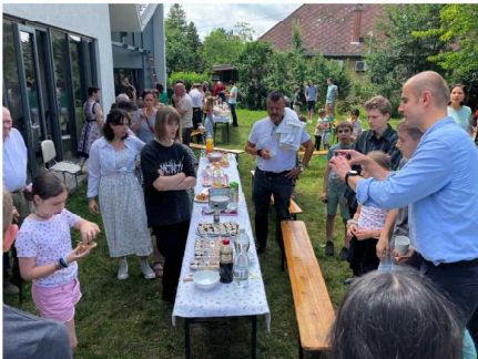
ディオーシュ教会で開催された寿司コンテスト。どれも本格的です。