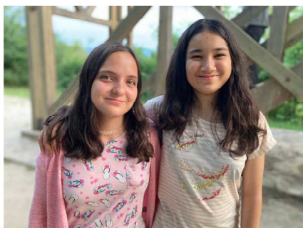
夏に行われた様々なキャンプの一コマ