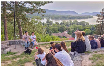
今年は良いキャンプ場が見つからず、礼拝も食事も屋外。雨が降らず感謝です。