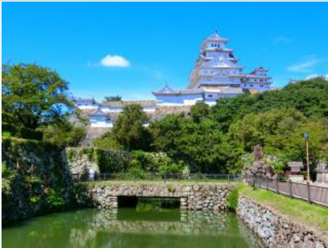
世界遺産 国宝 姫路城(兵庫県)