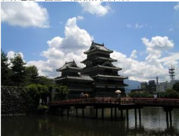
国宝 松本城(長野県)