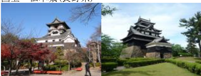
国宝 犬山城(愛知県) 国宝 松江城(島根県)