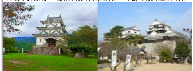
重要文化財 宇和島城 松山城(いずれも愛媛県)