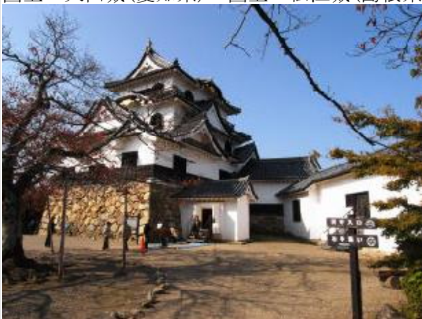
国宝 彦根城(滋賀県)