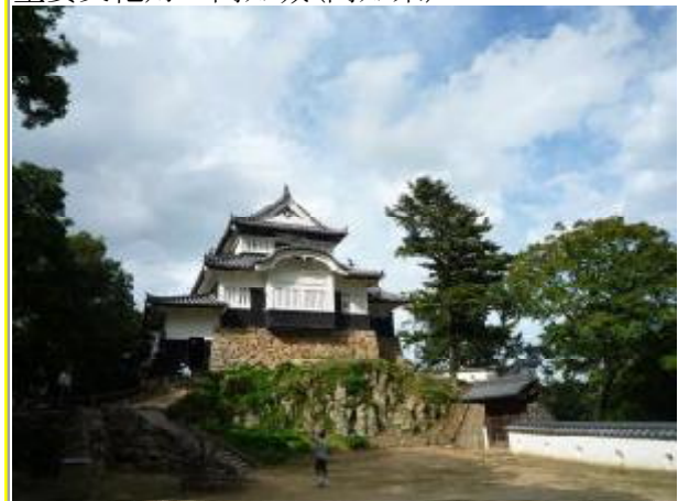
重要文化財 備中松山城(岡山県)