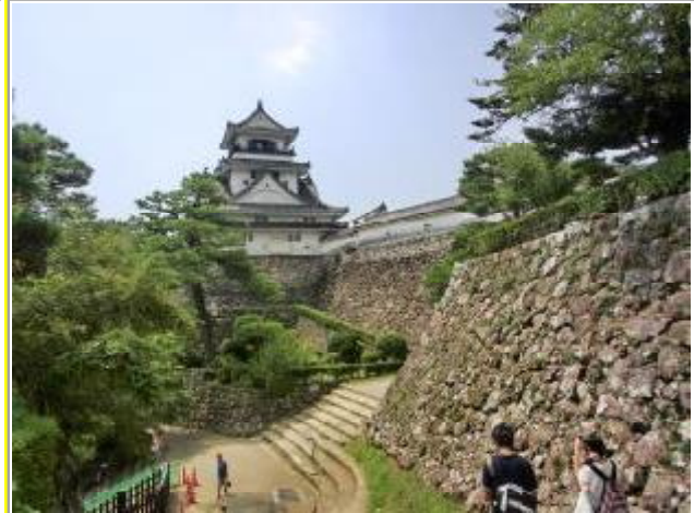
重要文化財 高知城(高知県)