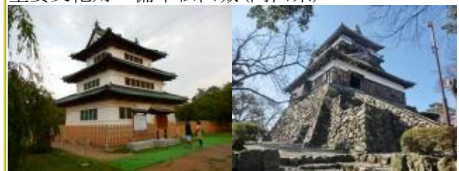
重要文化財 弘前城(青森県) 丸岡城(福井県)