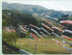
弥仙の里のこいのぼり