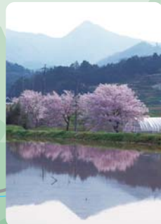
絶景ポイント①からの 春の弥仙山