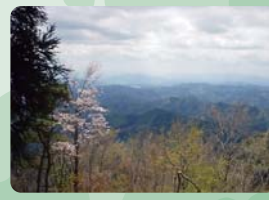
山頂からの眺望 絶景ポイント③