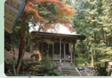
水分(みくまり)神社