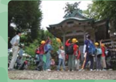
金峰(さんぼう)神社