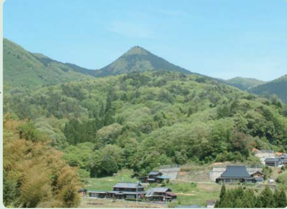
絶景ポイント②からの風景