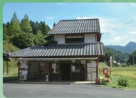
ふれあい弥仙の里で 登山マップをもらおう