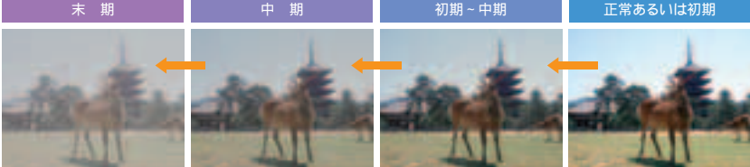
白内障進行により自覚される見え方の変化 (イメージ)

主な原因は加齢によるもので60代以上に多く見られますが、アトピーや薬剤が原因となる場合もあり、若い人でもかかる可能性があります。加齢による場合は防ぐことが難しいですが、ビタミンCを多く取っている人は