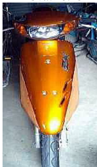
乗っていた原付バイク