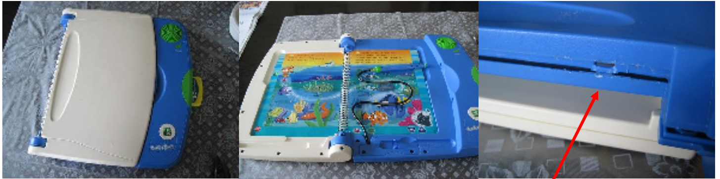
閉じる部分は爪がある