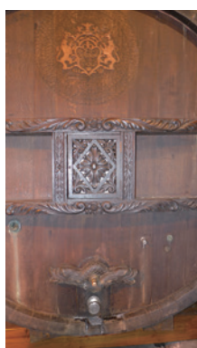
ギネスブック認定の 最古の現役樽