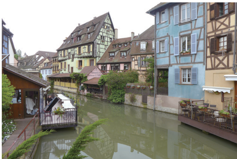
運河が張り巡らされたアルザスの街並み