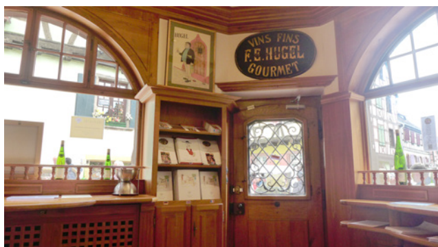
ヒューゲル社のテイスティングルーム