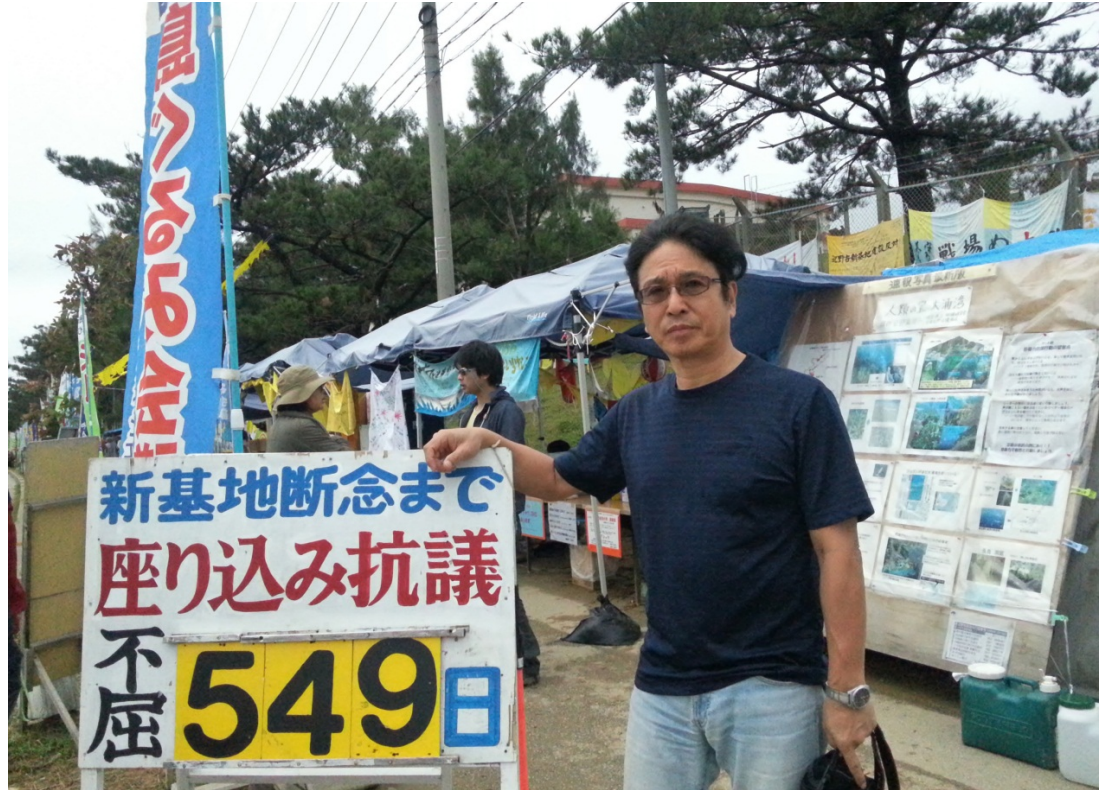
(連帯の挨拶されている本庄議長)