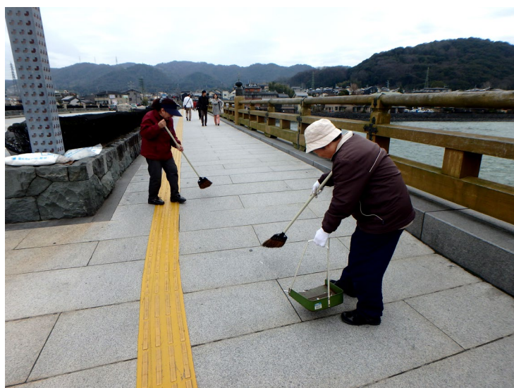
観光地清掃係 写真は宇治橋歩道部分の清掃作業 丁寧にやっってもらっていると高い信頼を得ています。

宇治高齢者事業団は、4月1日より日雇適用事業所を返上し、全て一般適用事業所として再スタートしました。