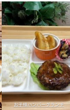
お子様ハンバーグランチ