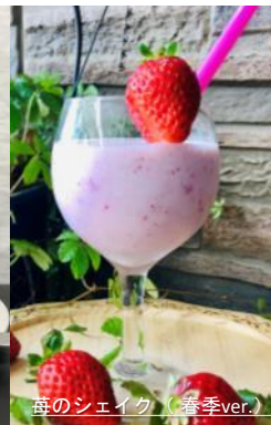
苺のシェイク (春季ver.)