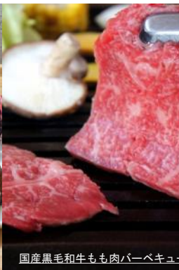
国産黒毛和牛もも肉/バーベキュー