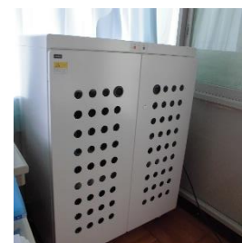
端末を収納したラック

GIGA スクール構想という言葉をお聞きになったことがありますか。児童向けの一人一台端末と通信ネットワークを一体的に整備し、多彩な子ども達の資質・能力が一層確実に育成できる教育 ICT 環境を実現する計画のことです。この計画を受け、本校にも今週初めに全児童分のタブレット PC を配置していただきました。文科省が示すように、これからの社会を生きる子どもたちにとって PC 端末は鉛筆やノートと並ぶアイテムであると思います。また、一人一台の端末環境は、多様な子どもたち一人ひとりにより適した学びや創造性を育む学びを提供することにもつながると思っています。新学習指導要領においても、「情報活用能力の育成を図るため、学校において、コンピュータや情報通信ネットワークなどの情報手段を活用するために必要な環境を整え、これらを適切に活用した学習活動の充実を図ること。」が示されています。初めは鉛筆やノートのようにはいきませんが、使ってこそその機器だと思えます。できるだけ早い時期に様々な環境整備や教職員の研修を行い、子どもたちの学習に有効に活用していきたいと思っています。また、使用を積み重ねる中で、子どもたちが ICT を適切・安全に使いこなすことができるようネットリテラシーなどの情報活用能力の育成に努めていきたいと思っています。