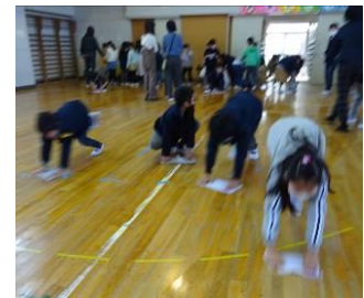
掃除ボランティア