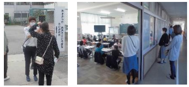
検温や廊下からの参観への協力にも感謝します

先週から今週にかけて、校内の密を避ける形で、3日間4時間に分けて本年度最初の参観日を実施しました。参観時間を1時間とさせていただいたことで、参観したい授業を見ていただけなかったり、慌ただしく複数の教室を回っていただいたりした方には、申し訳ありませんでした。多くの保護者の皆さんにご来校いただき、ありがとうございました。