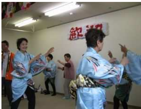
の皆さんと利用者の方と一緒に河内音頭を楽しく踊って頂きました。