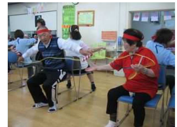
(*^^)v紅組対白組 皆さん力を合わせて頑張りました！