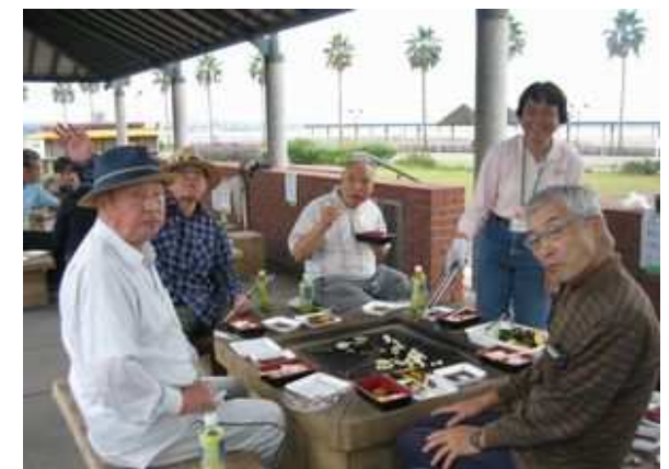
お肉いっぱい食べてお腹いっぱい！！