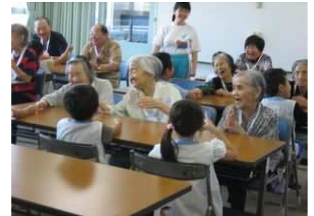
園児と手遊び皆さんとっても良い笑顔(^o^)