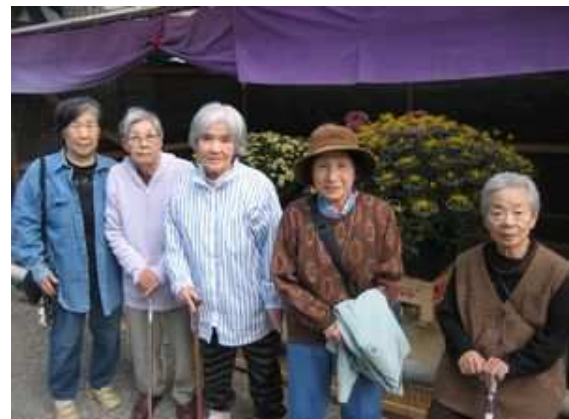
天気も良くみんなとっても良い笑顔 (*^_^*)