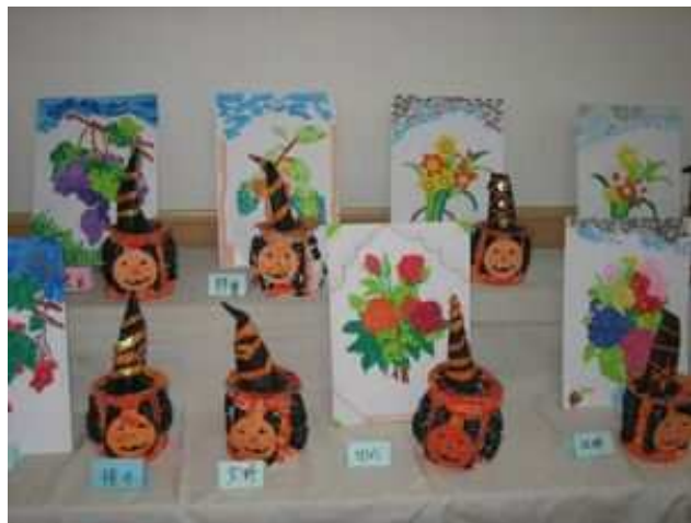
10/28～11/7まで皆さんが頑張って