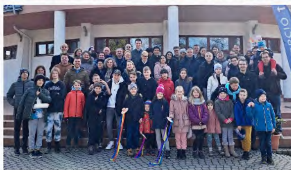
ディオージュ教会修養会 (バラトン湖にて)

先日のペンテコステ礼拝には、ユースに通う5人の高校生が信仰告白をしました。信仰告白後に教会を離れる青年たちが多く聞いています。それはハンガリー改革派教会における最も大きい課