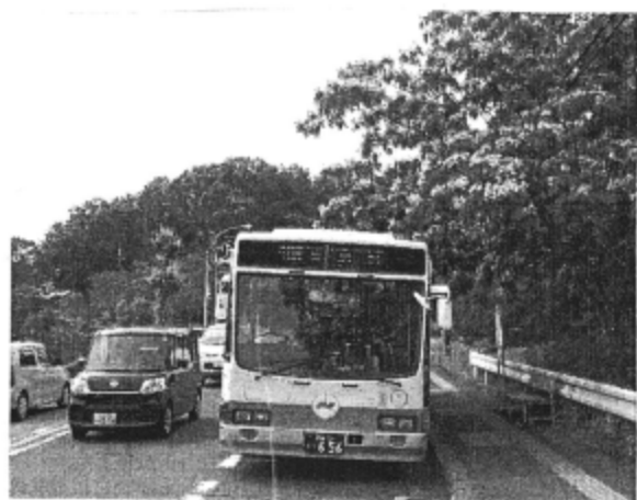
道路障害となっている樹木を伐採（東老春の家前） 道路安全のため「支障場所の連絡を」