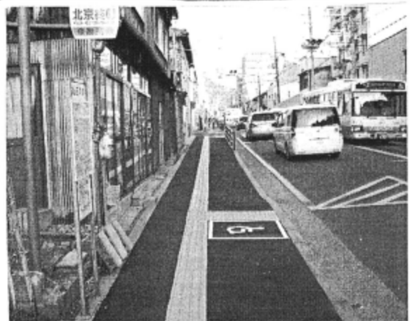
歩行者安全のため歩道改良。併せてバス停も