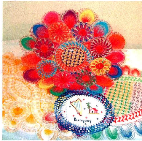
アンサンブル マルティータ

* パラグアイ女性&目の不自由な方達の 自立支援の為、伝統手工芸品のフェア トレードを応援しています