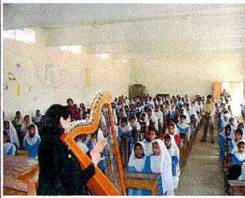
パキスタン：クエッタの小学校