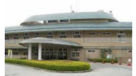
総合福祉センター（ゆうあいセンター）

6 月議会において「公の施設における指定管理者の指定の手續等に関する条例」が制定されました。今後、本町で管理委託している施設等については調査・検討が進められます。