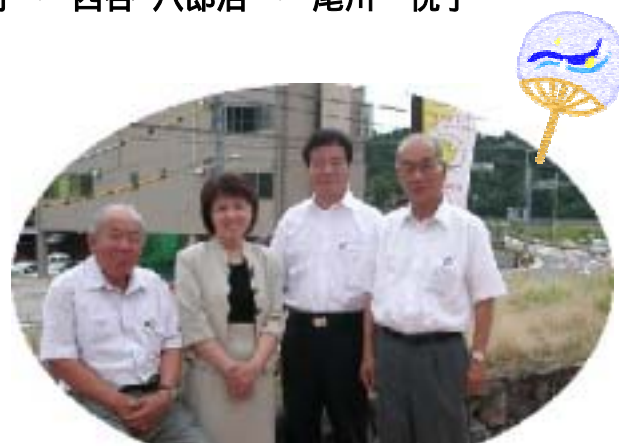
クールビズでごあいさつ

8 月 6 日(土)に開催の「全国川サミット in 猪名川」で皆様とお会いできることを楽しみにしています。