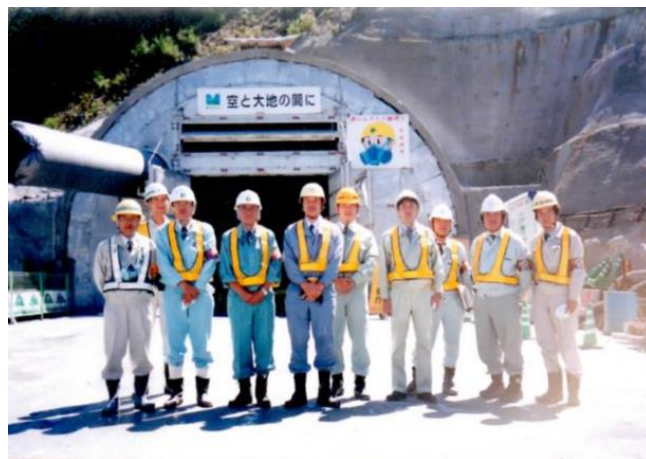
一般社団法人千葉労務安全教育研究会