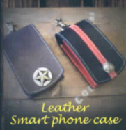
Leather Smart phone case