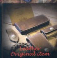
Leather Original item