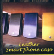
Leather Smart phone case