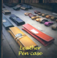
Leather Pen case