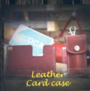
Leather Card case