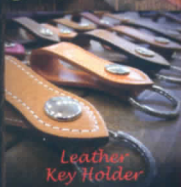
Leather Key Holder