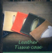
Leather Tissue case