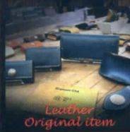
Leather Original item