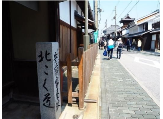
市内散策(北国街道)

●大阪 8:21 発 JR東海道本線(新快速)[長浜行]1時間 26分 ↓米原 JR北陸本線(新快速)[長浜行]10分 9:59 着 ■長浜