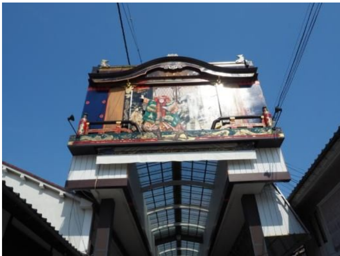
市内散策(アーケード入り口)