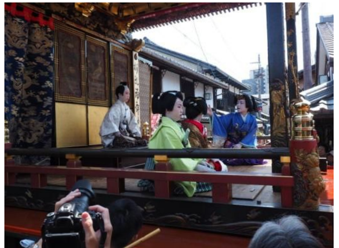
自町狂言(子ども歌舞伎)