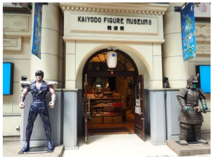
市内散策(海洋堂フィギュアミュージアム)