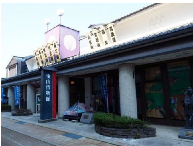
市内散策(曳山博物館)