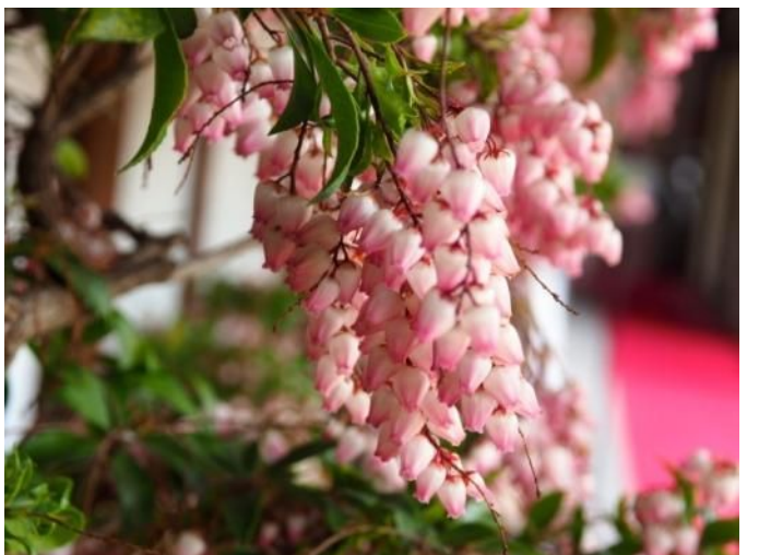
馬酔木(あせび)の花(大通寺)