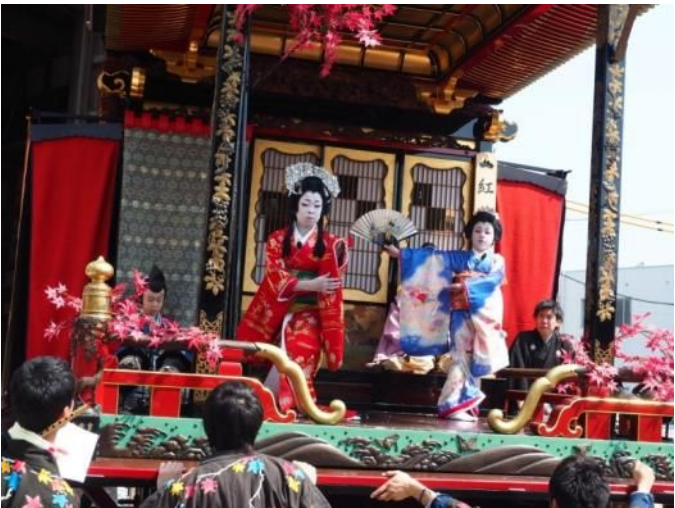
自町狂言(子ども歌舞伎)

●大阪 8:21 発 JR東海道本線(新快速)[長浜行]1時間 26分 ↓米原 JR北陸本線(新快速)[長浜行]10分 9:59 着 ■長浜