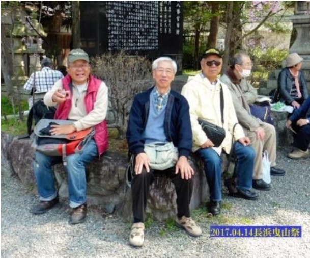
長浜八幡宮にて