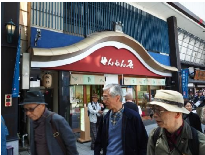
市内散策(地元企業)