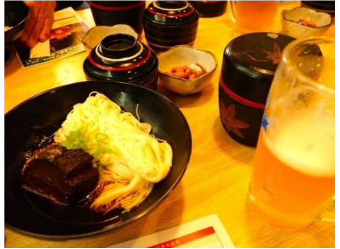
昼食(成駒家の鯖そうめん)