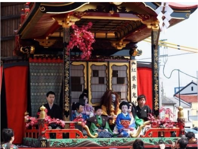
自町狂言(子ども歌舞伎)