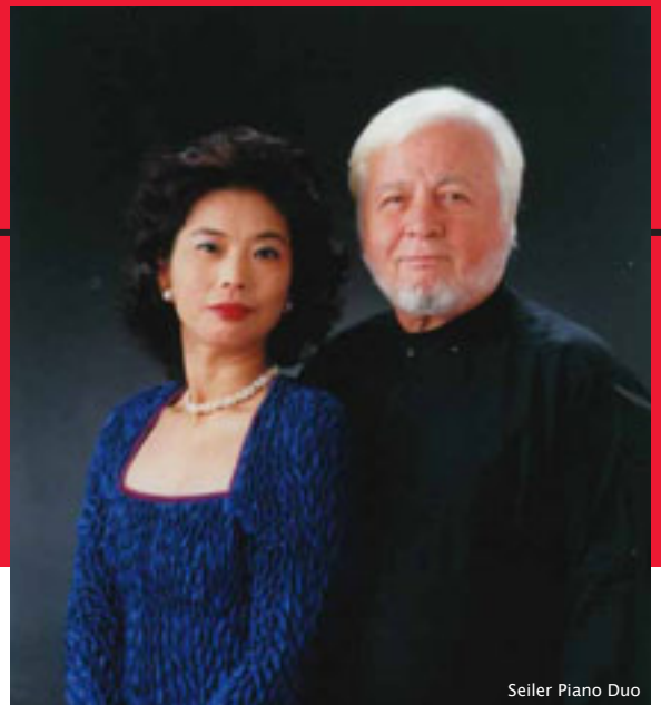
Seiler Piano Duo

Host and MC: Oto (England, Cornwall, traditional Japanese wood construction)