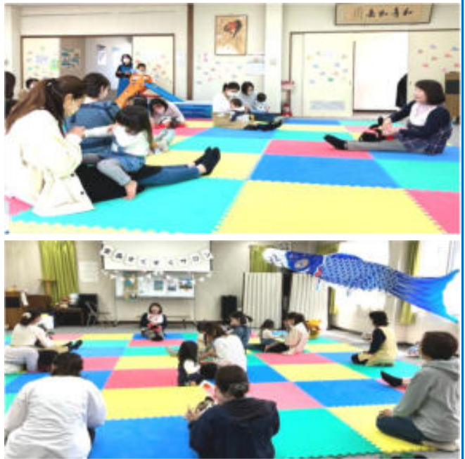
次回、6月22日(木)は、親子で紙粘土遊びをします。