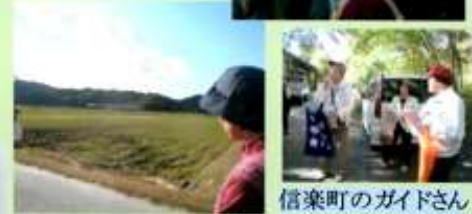
信楽町のガイドさん