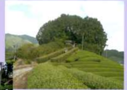
地元で『太鼓山』と呼ばれている茶畑の中の『安積親王陵墓』