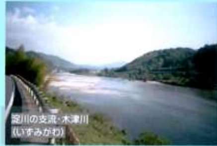
淀川の支流・木津川 (いすみがわ)