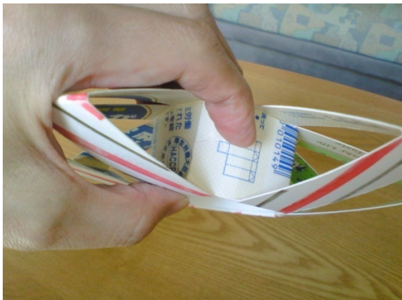
6. 中心部が輪になるように重ね合わせ、テープなどで固定する