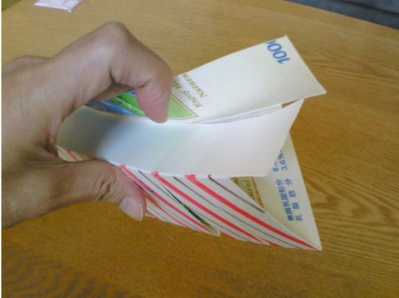
3. 中心を折り曲げ、1.5-2.0cm 位の幅で切れ目を入れる