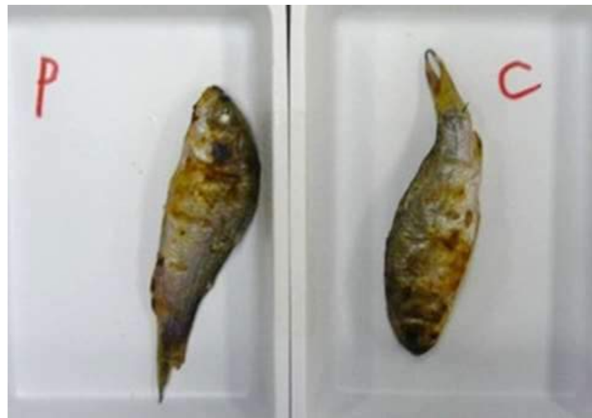
食味試験に供したコイ稚魚の素焼き (P:普通飼料で養殖、C:低リン飼料で養殖)