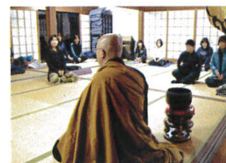
住職による坐禅指導