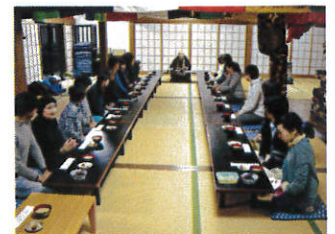
12月8日「ヨガと茶粥の会」