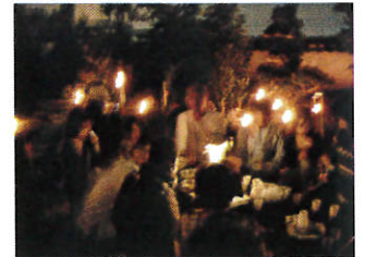
10月20日「お月見ヨガ」(茶話会)