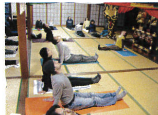
おでらヨガの様子

お申し込み・お問い合わせ 如意山長楽寺 篠山市郡家493番地 電話:079-552-1544 FAX:079-550-1451 eメール:mail@chorakuji.net ホームページ:http://www.chorakuji.net