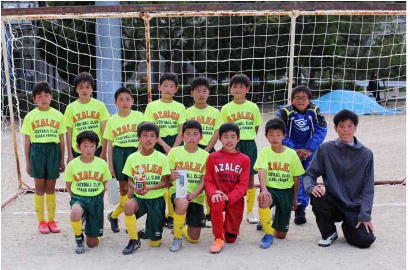
(2021.2.13-14 U-11) エデュケーションカップ (U-11) 準優勝!