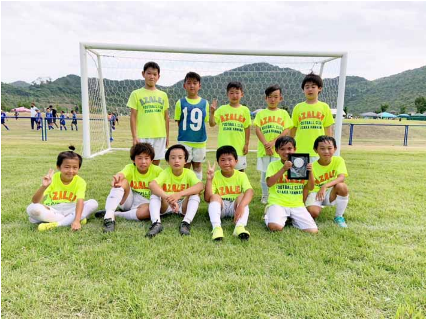
(2020.7.18-19 U-10) 2020 U-10 阪南カップ 準優勝！