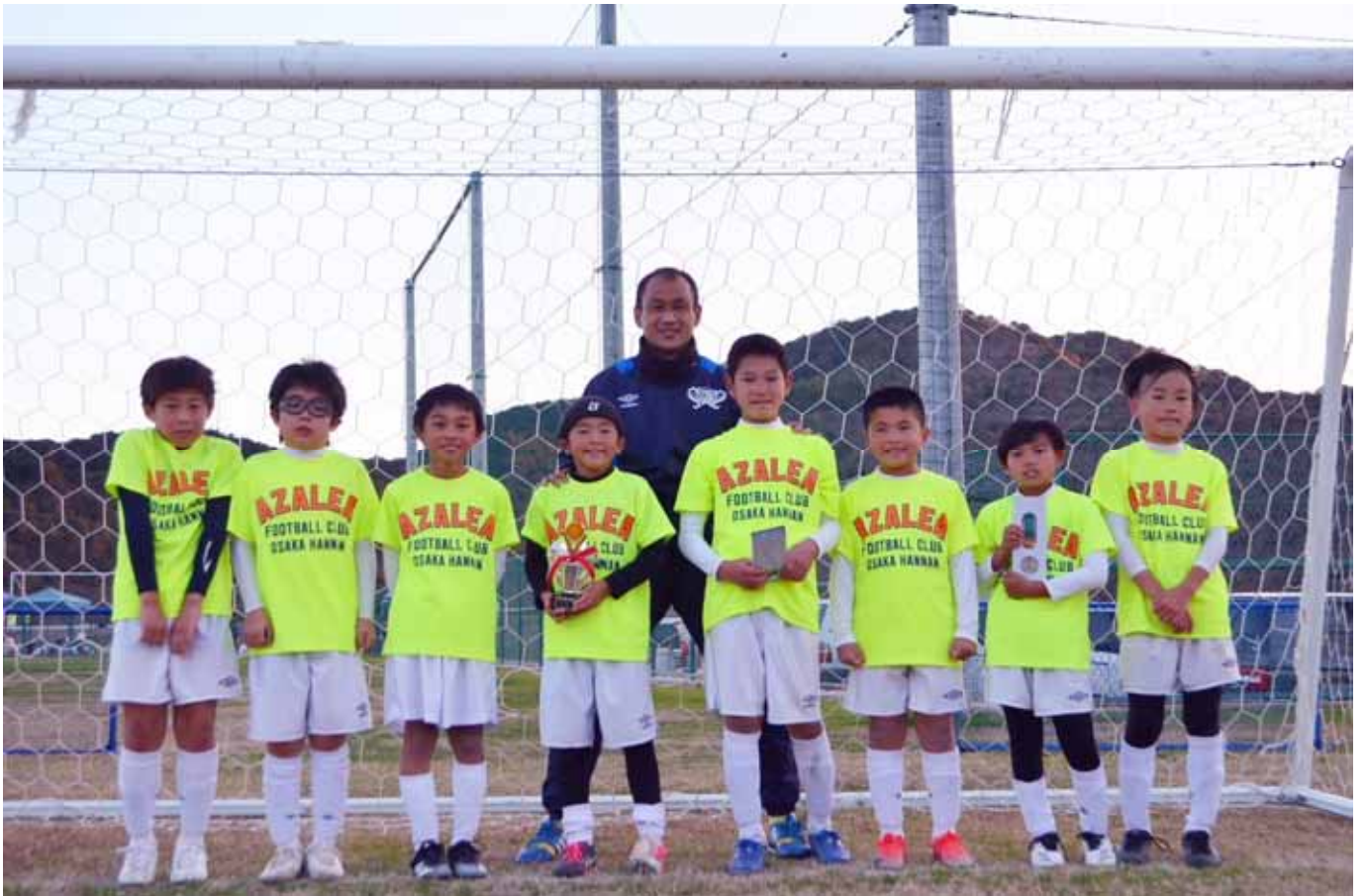
(2020.12.5 U-10) 第 20 回アゼリア杯 (U-10) 準優勝!