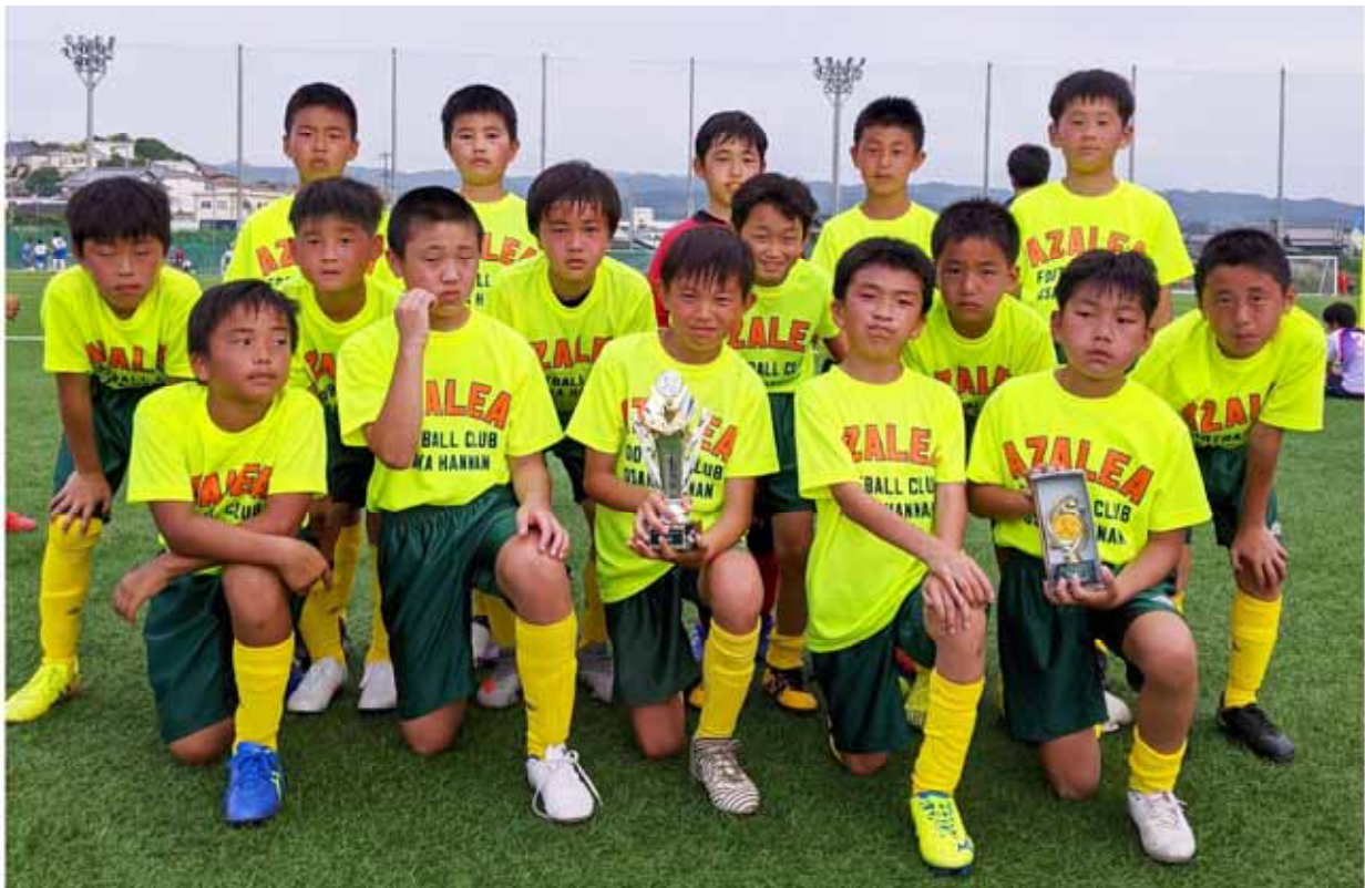
(2020.6.27-28 U-12) OSAKA South Champions Cup (2位 G トーナメント) 準優勝！