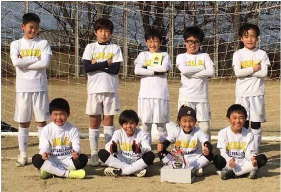
(2021.1.17 U-10) 阪南市サッカー連盟杯 U-10 優勝!