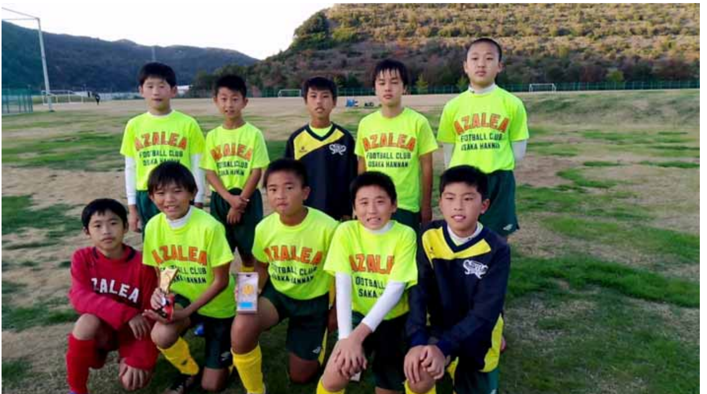
(2020.11.14-15 U-12) 2020 阪南連盟フェデレーションズカップ (2 位 GT) 準優勝! (10 位/32)