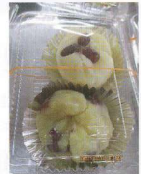
手作りのいもきんとん

対象者 ①75歳以上（65歳以上の障害のある方）の一人暮らしの方 ②共に80歳以上の高齢者世帯