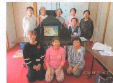
「ひまわり」の記念写真