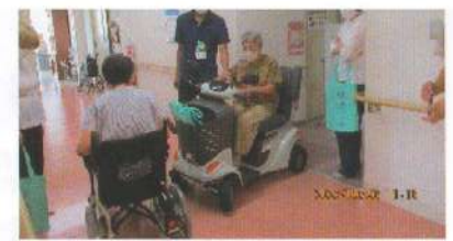
電動車椅子の試乗風景