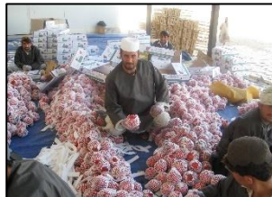
名産品のザクロを加工する男性