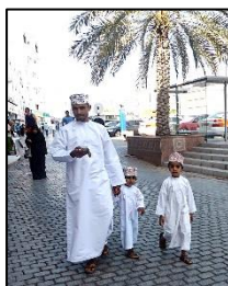
オマーン人の親子