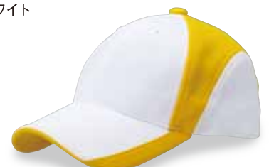
FC5-507 イエロー/ホワイト