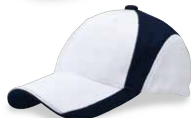
FC5-503 ネイビー/ホワイト