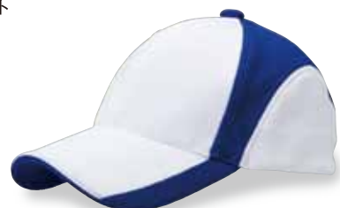
FC5-504 ロイヤルブルー/ホワイト