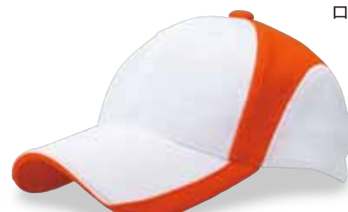
FC5-508 オレンジ/ホワイト