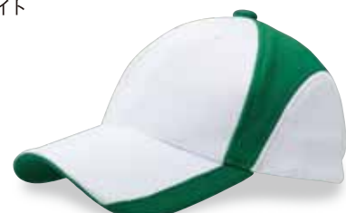
FC5-501 グリーン/ホワイト