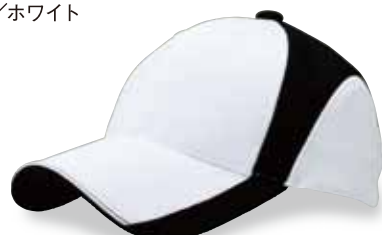
FC5-509 ブラック/ホワイト