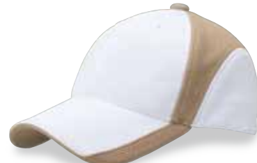
FC5-502 ベージュ/ホワイト