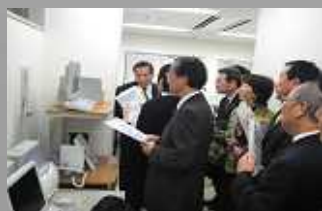
(12.8、加納病院・救急システム視察)