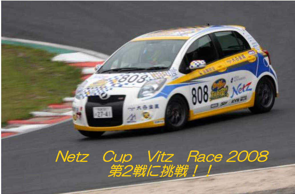
Netz Cup Vitz Race 2008 第2戦に挑戦！！