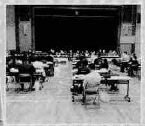
連合自治会定例会