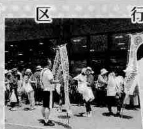
社会を明るくする運動