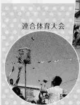
子どもスポーツ大会

結びに、「とにしネット」及び登美丘西校区の益々のご発展と、皆様のご健勝、ご多幸を祈念申し上げます。お祝いの言葉といたします。