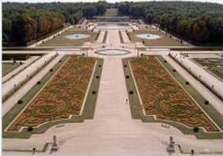
ヴォー＝ル＝ヴィコント城庭園

平面幾何学式庭園（フランス式庭園）は線対称、人工的な格式美に基づきます。一方、日本の文化は日本画 日本庭園 生け花 書道 和食の盛り付け等に見られるように、空間（余白）を大切にし、不等辺三角形の構図を好みます。非対称は自然美に基づきます。