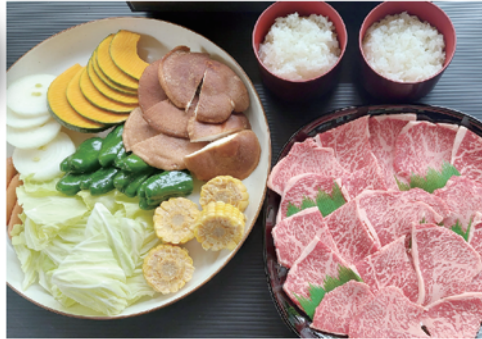
特選牛特上もも肉バーベキュー ¥7,000

コース内容（1人前） 牛もも肉 140g/ ウィンナー / 原木しいたけ / 各種焼き野菜 / ごはん（三田米コシヒカリ）1膳