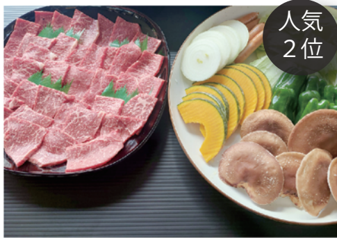
特選牛もも肉バーベキュー ¥5,000

写真はイメージです（4人前）。内容は予告なく変更する場合があります。グループ・団体様はその他ご要望にできる限りご対応致します。食品衛生上、食事場所への食材、飲料のお持ち込みは固くお断り致します。内容は予告なく変更する場合があります