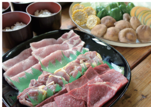
特選肉 3 種食べつくし BBQ ¥6,300

コース内容（1人前） 牛もも肉 70g/ 牛特上もも肉 70g/ ウィンナー / 原木しいたけ / 各種焼き野菜 / ごはん（三田米コシヒカリ）1膳