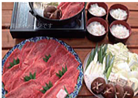
特選牛肉すき焼き ¥6,200

コース内容（1人前） 地鶏140g/ウィンナー / 原木しいたけ / 各種焼き野菜 / ごはん（三田米コシヒカリ）1膳