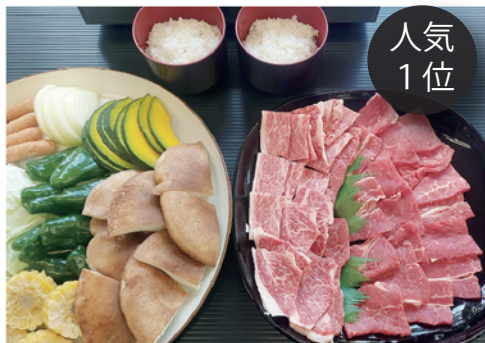
特選牛もも肉&特上もも肉 BBQ ¥6,000

コース内容（1人前） 牛特上へレ肉 140g/ ウィンナー / 原木しいたけ / 各種焼き野菜 / ごはん（三田米コシヒカリ）1膳