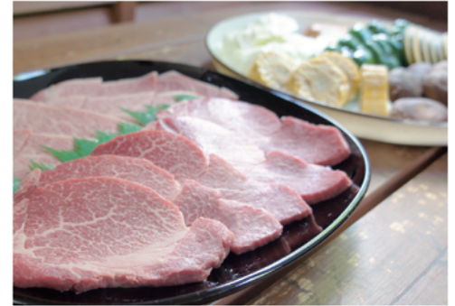
特選牛へレ肉バーベキュー ¥12,000～

コース内容（1人前） 牛特上もも肉 140g/ ウィンナー / 原木しいたけ / 各種焼き野菜 / ごはん（三田米コシヒカリ）1膳