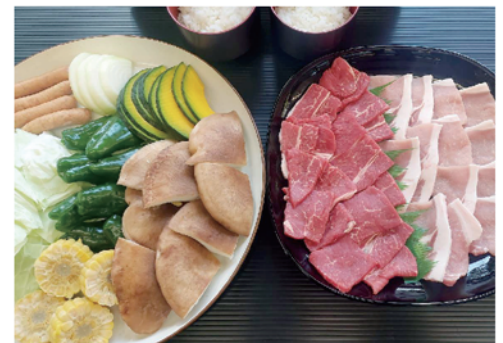
特選牛もも肉&豚ロース肉 BBQ ¥4,600

コース内容（1人前） 牛もも肉 70g/ 豚ロース 70g/ 地鶏70g / ウィンナー / 原木しいたけ / 各種焼き野菜 / ごはん（三田米コシヒカリ）1膳