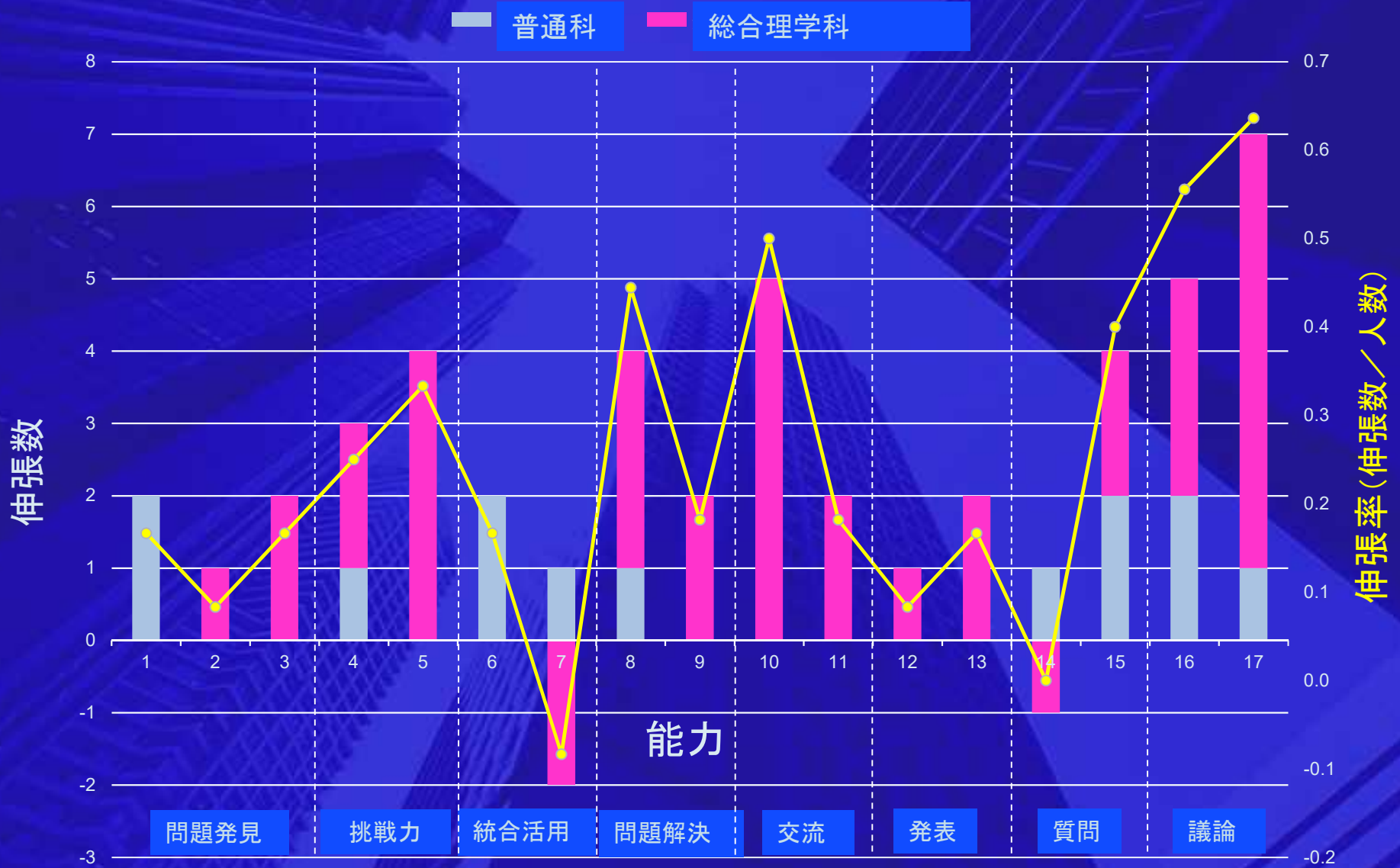
図1 実施前後での能力の変化