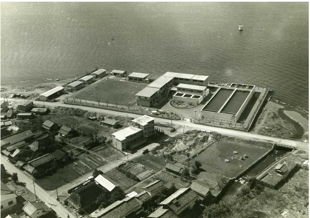
完成直後の下坂浜浄水場

湖北東部北地区簡易水道および山脇河毛簡易水道を高月上水道事業に統合 これら簡易水道地区に高月浄水場から給水を開始