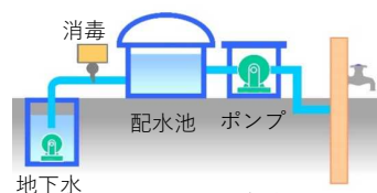
川道・錦織浄水場処理フロー