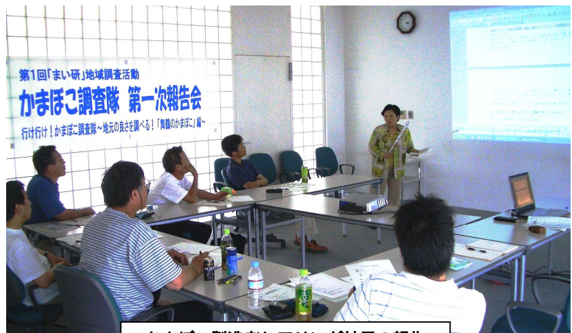
かまぼこ製造者ヒアリング結果の報告

現在、「かまぼこ市民アンケート」調査を実施中。このアンケート調査には、市民の皆さんの協力をはじめ、市役所職員の皆さんからも協力をいただいています。【7月末で700通を超える回答が寄せられています。】